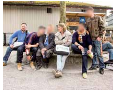
SUBITA am Merkurplatz