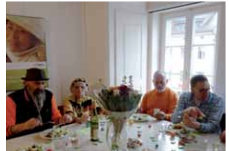
Osteressen bei SUBITA, mit 90-jährigem Geburtstagskind

Auf unserer Homepage subita.ch erfahren Sie mehr über unser breit gefächertes Arbeitsfeld.